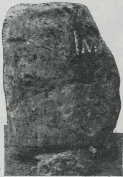
Fig. 582. — Miliari de Trayguera (Castelló). (Alt: 90 cm.)

Fixada la direcció dels itineraris, hem tractat de localitzar les estacions de trànsit entre Tortosa i Sagunt, valent-nos de mapes detallats i exactes i dividint la distància cartogràfica que separa les poblacions extremes, proporcionalment als nombres que separen les intermitges. A les dades obtingudes amb minucios càlcul matemàtic si afegixen les comprovacions arqueològiques damunt del terreny. Segons aquest mètode hem de localitzar Intibili en el curt trajecte de Trayguera a La Jana, Ildum en la proximitat de Vilanova d'Alcolea i Sebelaci a Sta. Quitèria, confluència del Millars i la Rambla de la Viuda al costat de Vilareial. Aquestes localitzacions geogràfiques coincideixen en llocs d'aigua abundosa, on hi han creuaments de vells camins i en que el terreny amb cert desnivell reuneix condicions defensives i de domini, circumstància pròpia del caràcter polític-militar de la via augusta. Refermen la correspondència de Intibili amb Trayguera, La Jana, i de Sebelaci amb Santa Quitèria, els molts restes romans d'aquestes localitats. Més segurs estem de la localització de Ildum i fins creiem haver trobat aquesta mansió, en els restes romans coneguts per L'Hostalot , situats al costat de la carretera actual no lluny del safareix públic de Vilanova d'Alcolea. Queden gruixudes parets d'aquest casalot amb altres restes de