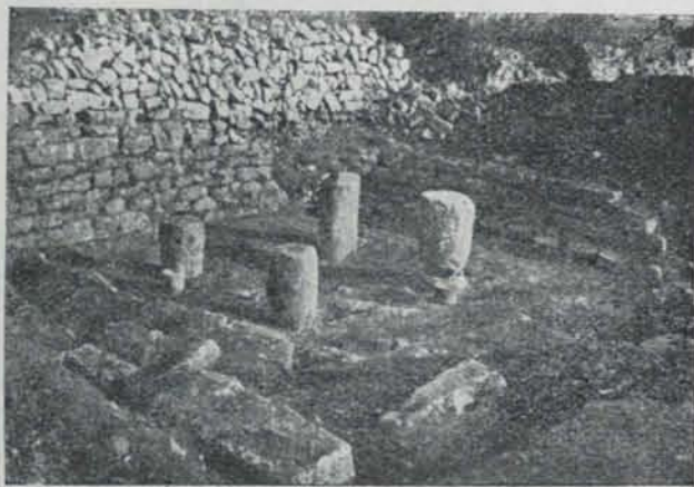
Fig. 585. — Habitació romana dels Antigors (Les Salines de Santanyí)

cent metres, de cendres i ossos d'animals junt amb ceràmica i algun objecte de bronze i ferro.